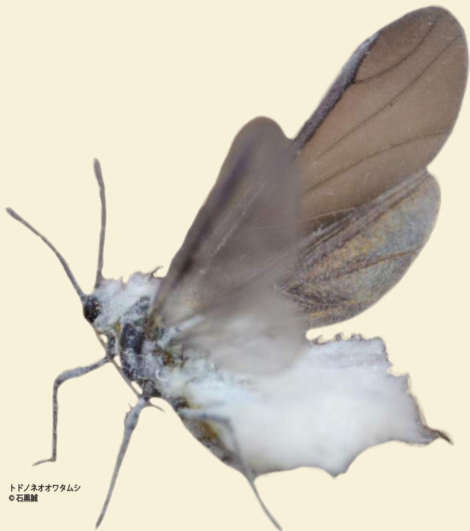
トドネオオワタムシ